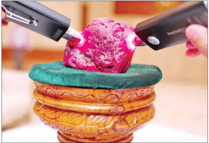
မိုးကုတ်ရတနာမြေမှ ရှာဖွေတွေ့ရှိသည့် ထူးခြားလှပပြီး အရွယ်အစားကြီးမားသော ပတ္တမြားကြီးအား တွေ့ရစဉ်။

အနားတက်ရောက်လာကြသူများသည် ပတ္တမြားကြီးအား ကြည့်ရှုကြသည်။ ယခုရှာဖွေတွေ့ရှိခဲ့သော ပတ္တမြားသည် အလေးချိန် ၂၅၀၀ ဂရမ် (၁၁၀၀၀ ကရက်) ရှိသဖြင့် အရွယ်အစားကြီးမားသောကြောင့် ရှာဖွေတွေ့ရှိရန် ခက်ခဲပြီး ရှားပါးကြောင်း၊ ပတ္တမြားကြီးအနေဖြင့် ခရမ်းရောင်သမ်းသော အနီရောင်တွင် အဝါရိပ်ဖောက်သောအရောင်ရှိပြီး အရောင်အဆင့်အတန်းအားဖြင့် ကောင်းမွန်ကြောင်း၊ အလင်းပေါက်အား သင့်တင့်ပြီးဖန်ရောင်လက်ကောင်းမွန်ကာ ပြုပြင်ထားခြင်းမရှိသော သဘာဝအတိုင်းရှိသည့် ပတ္တမြားကြီးဖြစ်ကြောင်း သိရှိရသည်။ ယခင်က မိမိတို့နိုင်ငံတွင် ရှားပါးပြီးတန်ဖိုးရှိသည့် ၁၉၉၀ ပြည့်နှစ်တွင် ရရှိခဲ့သော အလေးချိန်