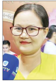
ဒေါ်ကြည်ကြည်စော်