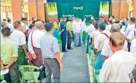
တွေ့ဆုံပွဲသို့ တိုင်းဒေသကြီးအဆင့် တာဝန်ရှိသူများ၊ ဖိတ်ကြား ထားသူများ စုစုပေါင်း ၁၅၉ ဦး တက်ရောက်ခဲ့ကြောင်း သိရသည်။ လ(ပြည့်လင်း(ပြန်/ဆက်))

ပန်းတောင်း မေ ၇ ပဲခူးတိုင်းဒေသကြီးလွှတ်တော်ဥက္ကဋ္ဌ ဦးအောင်ချိုဦးသည် ယနေ့ နံနက်ပိုင်းတွင် မြို့နယ်အထွေထွေအုပ်ချုပ်ရေးဦးစီးဌာန အစည်းအဝေး ခန်းမ၌ ပန်းတောင်းမြို့နယ်အတွင်းရှိ ဌာနဆိုင်ရာတာဝန်ရှိသူများ၊ ရပ်ကွက်၊ ကျေးရွာအုပ်စုအုပ်ချုပ်ရေးမှူးများ၊ မြို့မိမြို့ဖများ၊ လူမှုရေး အသင်းအဖွဲ့များနှင့် တွေ့ဆုံရုံ ဒေသပွဲမြို့ရေးလုပ်ငန်းများ ညှိနှိုင်း ဆွေးနွေးခဲ့သည်။ ဦးစွာ တိုင်းဒေသကြီးလွှတ်တော်ဥက္ကဋ္ဌက ဒေသတွင်းတည်ငြိမ် အေးချမ်းရေးနှင့် ဖွံ့ဖြိုးတိုးတက်ရေးလုပ်ငန်းများ ဆောင်ရွက်ရာတွင် ဌာနဆိုင်ရာများသာမက ရပ်ကွက်၊ ကျေးရွာအုပ်ချုပ်ရေးအဖွဲ့များ၊ မြို့မိ မြို့ဖများနှင့် လူမှုရေးအသင်းအဖွဲ့များအားလုံး ဟန်ချက်ညီညီ ပူးပေါင်း ဆောင်ရွက်ကြရန် လိုအပ်ကြောင်း၊ ပြည်သူတို့၏အသက်ကို နားစွင့်ပြီး လိုအပ်ချက်များကို အစိုးရနှင့် လွှတ်တော်တို့က အတတ်နိုင်ဆုံး ပြည့်ဆည်း ဆောင်ရွက်ပေးသွားမည်ဖြစ်ကြောင်း အမှာစကားပြောကြား