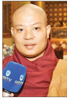
အရှင်ကေလာသ