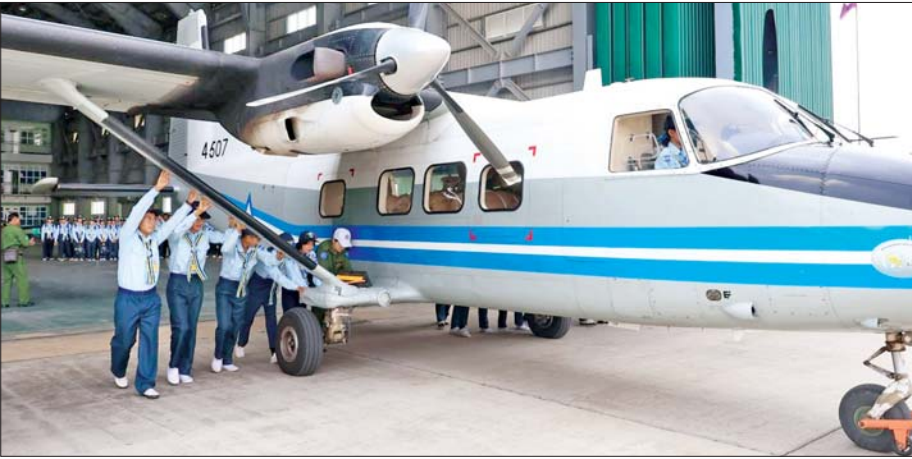
လေကြောင်းလူငယ်သင်တန်းသားများ လေယာဉ်မောင်းနှင်ခြင်းဘာသာရပ်ကို လက်တွေ့လေ့ကျင့်ကြစဉ်။