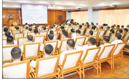
သင်တန်းဆိုင်ရာ လမ်းညွှန်ချက် များ ပြောကြားသည်။ အခမ်းအနားသို့ ရန်ကုန်တိုင်း ဒေသကြီးလွှတ်တော်ဥက္ကဋ္ဌ ဒုတိယ ဥက္ကဋ္ဌနှင့် ပြည်သူ့လွှတ်တော်နှင့် အမျိုးသားလွှတ်တော် ကိုယ်စား

လူငယ် နှစ်ဦး အပါအဝင် လွှတ်တော် ကိုယ်စားလှယ် ၉၄ ဦးနှင့် အလုပ်ရုံ ဆွေးနွေးပွဲကို ဦးဆောင်ဆွေးနွေး မည့် ရန်ကုန်တိုင်းဒေသကြီး လွှတ်တော် ဥပဒေရေးရာနှင့် အထူးကိစ္စရပ်များ လေ့လာသုံးသပ် ရေးအဖွဲ့မှ ဥပဒေပညာရှင်များ၊ လွှတ်တော်ရုံးမှ တာဝန်ရှိသူများ တက်ရောက်ကြသည်။ အဆိုပါ အလုပ်ရုံဆွေးနွေးပွဲကို မေ ၁၄ ရက်အထိ ဆောင်ရွက် သွားမည်ဖြစ်ကြောင်း သိရသည်။ အောင်မြင်(ပြန်/ဆက်)