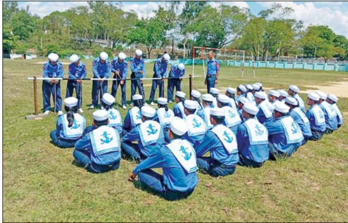
ရေကြောင်းလူငယ်သင်တန်းသားများ ကြိုးချည်ကြိုးထိုးသင်ခန်းစာများ လေ့ကျင့်သင်ကြားစဉ်။

ထိုသို့ လေ့ကျင့်သင်ကြားလျက်ရှိရာ ယနေ့တွင် ရေတပ်သားဘာသာရပ်၌ ပါဝင်သည့် ရေကြောင်း ဝေါဟာရ ကျောက်ဆူးနှင့် ကျောက်ကြိုးသင်ခန်းစာ၊ ရေယာဉ်ကိုင်တွယ်မောင်းနှင်မှုနှင့် တက်မထိန်း သင်ခန်းစာ၊ ကျေးဘာသာရပ်၌ပါဝင်သည့် ခြေခတ်၊ လက်ဆွဲမြေပြင်သင်ခန်းစာ၊ ပက်လက်ကူး၊ ပေါင်းစပ် ကူးခတ်ခြင်း၊ မောက်လျက်ကူးသင်ခန်းစာများကို နေပြည်တော်ကောင်စီနယ်မြေရှိ နေပြည်တော် ရေကြောင်းလူငယ်စခန်းမှ သင်တန်းသား သင်တန်းသူ ၉၅ ဦး၊ ရန်ကုန်တိုင်းဒေသကြီး ရန်ကုန်မြို့ရှိအင်းယား ရေကြောင်းလူငယ်စခန်းမှ သင်တန်းသား သင်တန်းသူ ၁၀၀၊ ကိုကိုးကျွန်းမြို့ရှိ ရေကြောင်းလူငယ်စခန်းမှ သင်တန်းသား သင်တန်းသူ ၃၅ ဦး၊ ကရင်ပြည်နယ် ဘားအံမြို့ရှိ ရေကြောင်းလူငယ်စခန်းမှ သင်တန်းသား သင်တန်းသူ ၁၂၀၊ ရှမ်းပြည်နယ် ကျိုင်းတုံမြို့ရှိ ရေကြောင်းလူငယ်စခန်းမှ သင်တန်းသား သင်တန်းသူ ၆၀၊ ဧရာဝတီတိုင်းဒေသကြီး ဟိုင်းကြီးကျွန်းမြို့ရှိ ရေကြောင်းလူငယ်စခန်းမှ သင်တန်းသား သင်တန်းသူ ၅၀၊ ပုသိမ်မြို့ရှိ ရေကြောင်းလူငယ်စခန်းမှ သင်တန်းသား သင်တန်းသူ ၆၅ ဦး၊ မွန်ပြည်နယ် မော်လမြိုင်မြို့ရှိ ရေကြောင်းလူငယ်စခန်းမှ သင်တန်းသား သင်တန်းသူ ၆၀၊ တနင်္သာရီတိုင်း ဒေသကြီး ဟိန်းစံဒေသရှိ ရေကြောင်းလူငယ်စခန်းမှ သင်တန်းသား သင်တန်းသူ ၄၀၊ မြိတ်မြို့ရှိ ရေကြောင်း