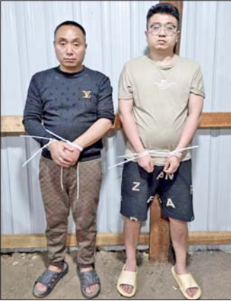
ရှမ်းပြည်နယ်(တောင်ပိုင်း) မိုင်းပန်မြို့နယ်အတွင်း မေ ၆ ရက်တွင် တရားမဝင် အွန်လိုင်းလိမ်လည်လောင်းကစားမှုကျူးလွန်သူ တရုတ်နိုင်ငံသားနှစ်ဦး ဖမ်းဆီးရမိမှုကို တွေ့ရစဉ်။

နေပြည်တော် မေ ၇ မြန်မာနိုင်ငံအစိုးရအနေဖြင့် တစ်ကမ္ဘာလုံးကို အန္တရာယ်ပေးနေသည့် အွန်လိုင်းလိမ်လည်မှုများ၊ အွန်လိုင်းလောင်းကစားမှုများ တိုက်ဖျက်ရေးလုပ်ငန်းစဉ်များကို အမျိုးသားရေးတာဝန်တစ်ရပ်အနေဖြင့် အလေးထားတိုက်ဖျက် ဆောင်ရွက်လျက်ရှိပြီး မြန်မာနိုင်ငံအတွင်း လုံးဝအခြေမပြုနိုင်ရေးအတွက် ပြည်တွင်းအင်အားစုများအပြင် အိမ်နီးချင်းနိုင်ငံ အစိုးရများနှင့်လည်း ပေါင်းစပ်ညှိနှိုင်း၍ တက်ကြွစွာ ဆောင်ရွက်လျက်ရှိသည်။ ထိုကဲ့သို့ လုံခြုံရေးပေးပေါင်းအဖွဲ့များက သက်ဆိုင်ရာနယ်မြေများအတွင်း အွန်လိုင်းလိမ်လည်လောင်းကစားမှုလုပ်ကိုင်သူများ အခြေပြုနေထိုင်ခြင်းမရှိရန်နှင့် အွန်လိုင်းလိမ်လည်လောင်းကစားမှုများ ဆောင်ရွက်ခြင်းမရှိရန်အတွက် နယ်မြေရှင်း