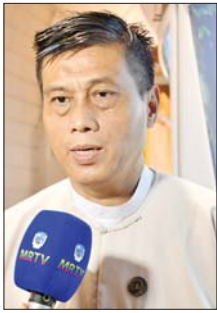
ဦးအောင်ဆန်းဝင်း

ရန်ကုန် မေ ၇ ဆဋ္ဌသင်္ဂါယနာတင် အောင်ပွဲ နှစ်(၇၀)ပြည့် အထိမ်းအမှတ် အထူးပြပွဲကို ရန်ကုန်မြို့ မရမ်းကုန်း မြို့နယ် သီရိမင်္ဂလာကမ္ဘာအေး ကုန်းမြေ မဟာပါသာဏလုံဏီဂူ သိမ်တော်ကြီးပတ်လမ်းတွင် ပြသ လျက်ရှိရာ ယနေ့တွင် နိုင်ငံတော် ပရိယတ္တိ သာသနာတက္ကသိုလ် (ရန်ကုန်)၊ ရွှေတိဂုံစေတီတော်၊ ဗိုလ်တထောင် ကျိုက်ဒေးအပ် ဆံတော်ဦး စေတီတော်တို့မှ ဂေါပကအဖွဲ့နှင့် ဝန်ထမ်းမိသားစု များ၊ လှည်းကူးပညာရေးဒီဂရီ ကောလိပ်၊ သဒ္ဓါဓိပတိ သီလရှင် စသည့်တို့က၊ မင်္ဂလာဒုံမြို့နယ် တောတိုက်ခရိုင်သာ ဘုန်းတော် ကြီးသင် ပညာရေးကျောင်းတို့မှ ကျောင်းသား ကျောင်းသူများ၊ စိတ်ပင်စားသူ ရဟန်းရှင်လူ ပြည်သူများ လာရောက်ကြည့်ရှု လေ့လာကြရာ ငင်းတို့၏ ပြပွဲနှင့် ပတ်သက်သည့် သဘောထား အမြင်များကို ဖော်ပြလိုက်ရပါ သည်။