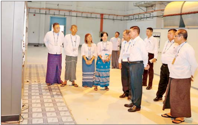
ပြည်ထောင်စုဝန်ကြီး ဦးထိန်လင်း တပ်ကုန်းမြို့ရှိ မြန်မာ့အသံနှင့် ရုပ်မြင်သံကြားတွင် ကြည့်ရှု စစ်ဆေးစဉ်။

ထိုသို့ တွေ့ဆုံစဉ် ပြည်ထောင်စုဝန်ကြီးက နိုင်ငံတော်အစိုးရ၏လမ်းညွှန်ချက်များနှင့် ဆောင်ရွက် ချက်များအား ပြည်သူ့လူထုက ထဲထဲဝဲဝဲသိရှိ ရန်အတွက် ပြန်ကြားရေးဝန်ကြီးဌာနအနေဖြင့် အဓိကကျသော အခန်းကဏ္ဍမှ တာဝန်ယူဆောင်ရွက် ရမည်ဖြစ်ကြောင်း၊ စိုက်ပျိုးရေးနှင့် မွေးမြူရေးကို အခြေခံသည့်နိုင်ငံဖြစ်သည့်အားလျော်စွာ ကျေးလက်နေ ပြည်သူများအတွက် အကျိုးရှိစေမည့်သတင်းအချက် အလက်များကို ဦးစားပေးထုတ်လွှင့်ပေးရန် လိုအပ် ကြောင်း၊ ထို့ပြင် ဒေသတစ်ခု ထုတ်ကုန်တစ်ခု (One Region၊ One Product) မူဝါဒဖြင့် အကောင်အထည် ဖော်နေသည့် အသေးစား၊ အငယ်စားနှင့်အလတ်စား စီးပွားရေးလုပ်ငန်း (MSME) များ ပွံ့ဖြိုးတိုးတက်ရေး အတွက် မီဒီယာကဏ္ဍမှ ပံ့ပိုးကူညီပေးရန်နှင့်