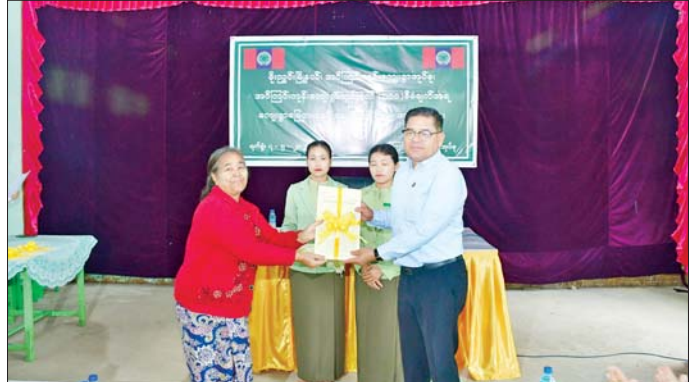
ကြပ်မက်မှုကို ကြည့်ရှုအားပေးပြီး ဒေသခံတောင်သူများ ပြည်နယ်ဝန်ကြီးချုပ်က ဌာနဆိုင်ရာတာဝန်ရှိသူနှင့်တွေ့ဆုံ၍ တောင်သူများ၏ စိုက်ပျိုးရေး ဓာတ်မြေများနှင့် ပေါင်းစပ်ညှိနှိုင်း၍ ပြည့်ဆည်းဆောင်ရွက်ပေးခြင်းကို ရက် ၁၀၀ စီမံချက်ဖြင့် ဆောင်ရွက်ပေးခဲ့ကြောင်း သိရသည်။ (ပြည်နယ်(ပြန်/ဆက်)