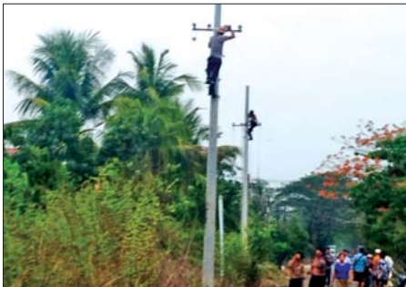
ယင်းနေ့ ၂၂ နာရီ မိနစ် ၄၀ တွင် ဓာတ်အား ပြန်လည်ဖြန့်ဖြူးပေးထားနိုင်ခဲ့ကြောင်း သိရသည်။

ရရှိရေးအတွက် ပျက်စီးသွားသည့် ဓာတ်အားလိုင်းနှင့် တိုင်များကို အစားထိုး တည်ဆောက်ပြုပြင်ခြင်းလုပ်ငန်းများ ဆောင်ရွက်ခဲ့ရာ