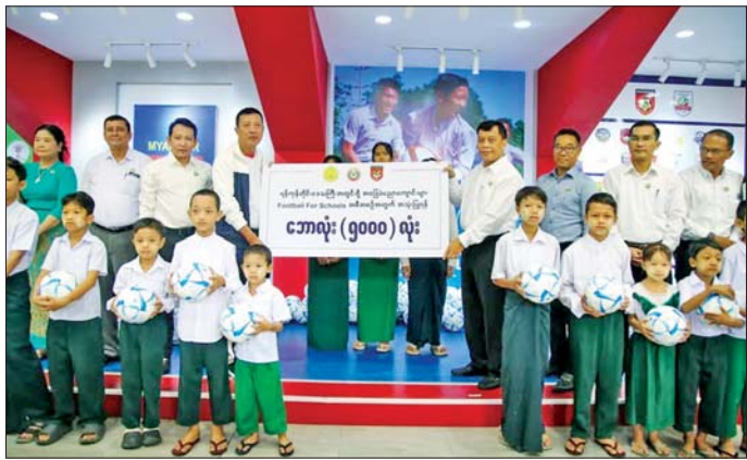
ရန်ကုန်တိုင်းဒေသကြီး ဝန်ကြီးချုပ် ဦးအောင်နိုင်သူထံ မြန်မာနိုင်ငံဘောလုံးအဖွဲ့ချုပ် ဥက္ကဋ္ဌ ဦးဇော်ဇော်က ရန်ကုန်တိုင်းဒေသကြီးအတွင်းရှိ အခြေခံပညာကျောင်းများ Football For Schools အစီအစဉ်တွင် အသုံးပြုရန် ဘောလုံးအလုံး ၅၀၀၀ ကို ပေးအပ်စဉ်။

လက်ခံရယူသည်။ မေ ၉ ရက်တွင် ကျင်းပသည့် MFF U-19 ဖူဆယ်လိဂ်ပြိုင်ပွဲ ပွဲစဉ်(၁)တွင် YRG အသင်းက YCDC Dream Team အသင်းကို ခြောက်ဂိုး-နှစ်ဂိုး၊ ULAD အသင်းက မင်္ဂလာဒုံစီးတီးအသင်းကို ရှစ်ဂိုးပြတ်၊ JV အသင်းက United City အသင်းကို နှစ်ဂိုး-တစ်ဂိုး၊ Pacific Sun Far အသင်းက Burmese Warriors အသင်းကို ရှစ်ဂိုးပြတ်၊ MIU အသင်းက Gold Dream အသင်းကို ငါးဂိုး-နှစ်ဂိုး၊ Royal Noka အသင်းက ရွှေပြည်သာယူနိုက်တက်အသင်းကို ခြောက်ဂိုး-တစ်ဂိုးဖြင့် အနိုင်ရရှိခဲ့ကြောင်း သိရသည်။ သတင်း - ကိုညီလေး