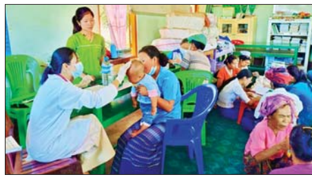
လုပ်ငန်းများဆောင်ရွက်ခဲ့ရာ ကျေးလက်နေပြည်သူ ၂၅၃ ဦးတို့အား ကျန်းမာရေး အခမဲ့ကွင်းဆင်းကြည့်ရှုကုသမှုပေးခဲ့ကြောင်း သိရသည်။ မြို့နယ်(ပြန်/ဆက်)

ကလေး မေ ၉ ရှမ်းပြည်နယ်(တောင်ပိုင်း) ကလေးမြို့နယ် ပြည်နယ် တီဘီတိုက်ဖျက်ရေးဌာနနှင့် မြို့နယ်ပြည်သူ့ကျန်းမာရေးဦးစီးဌာနတို့ ပူးပေါင်း၍ မေ ၆ ရက်က ပွေးလှရွှေကျန်းကျေးရွာရှိ ပြည်သူများအား ကျန်းမာရေးစောင့်ရှောက်မှု အခမဲ့ကွင်းဆင်းဆောင်ရွက်သည်။ ထိုသို့ကွင်းဆင်းဆောင်ရွက်ရာတွင် ရှမ်းပြည်နယ် တီဘီတိုက်ဖျက်ရေးဌာန၊ ကလေးမြို့နယ် ပြည်သူ့ကျန်းမာရေးဦးစီးဌာန၊ အောင်ပန်းတိုက်နယ်ကျေးလက်ကျန်းမာရေးဌာနတို့မှ ကျန်းမာရေးဝန်ထမ်းများက မြေခြားကျေးလက်ကျန်းမာရေးဌာန၌ လက်အောက်ရှိ ပွေးလှရွှေကျန်းကျေးရွာရှိ ကျေးလက်နေပြည်သူများအား တီဘီရောဂါရှာဖွေ စစ်ဆေးခြင်း၊ ကျန်းမာရေးစောင့်ရှောက်မှုပေးခြင်းနှင့် ကျေးလက်ဒေသအောက်ခြေအထိ ကျန်းမာရေးနှင့်ပတ်သက်၍ အသိပညာပေးခြင်း