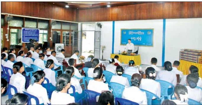
ပြည်ထောင်စုဝန်ကြီး ဦးထိန်လင်း ပြန်ကြားရေးနှင့် ပြည်သူ့ဆက်ဆံရေးဦးစီးဌာန မန္တလေးတိုင်းဒေသကြီးရုံး အစည်းအဝေးခန်းမ၌ ပြန်ကြားရေးဝန်ကြီးဌာနအောက်ရှိ ဦးစီးဌာနများနှင့် လုပ်ငန်းတို့မှ အရာထမ်း၊ အမှုထမ်းများအား တွေ့ဆုံအမှာစကားပြောကြားစဉ်။

နေပြည်တော် မေ ၉ ပြန်ကြားရေးဝန်ကြီးဌာန ပြည်ထောင်စုဝန်ကြီး ဦးထိန်လင်းသည် ယနေ့တွင် စစ်ကိုင်းတိုင်းဒေသကြီးနှင့် မန္တလေးတိုင်းဒေသကြီးတို့အတွင်း ဆောင်ရွက်နေသည့် ပြန်ကြားရေးနှင့် ပြည်သူ့ဆက်ဆံရေးလုပ်ငန်းများ၊ ရုပ်သံထုတ်လွှင့်မှုလုပ်ငန်းများနှင့် သတင်းစာရိုက်နှိပ်ထုတ်ဝေမှုတို့ကို ကြည့်ရှုစစ်ဆေးသည်။