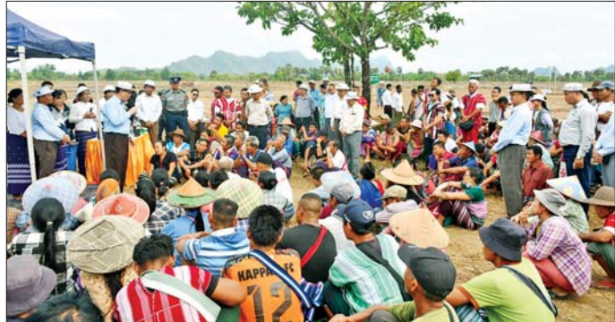
ကရင်ပြည်နယ် ဝန်ကြီးချုပ် ဦးစောမြင့်ဦး တောင်သူများအား တွေ့ဆုံမှာကြားစဉ်။

ကရင်ပြည်နယ်မှ မြေဆီလွှာ ဖွံ့ဖြိုးတိုးတက်ရေးလုပ်ငန်းများ အနေဖြင့် ဧေထယ်ရေးဆဲထားသော ဝါးဆူးကွင်း၌ သဘာဝမြေဓာတ်ထည့်သွင်းခြင်း၊ ထုံးထည့်သွင်းခြင်း၊ သစ်စိမ်းမြေဓာတ် (ပိုက်ဆံလျှော်) ကြွပ်ကဲခြင်းတို့ကို ကွင်းသရုပ်ပြရာ ကရင်ပြည်နယ်ဝန်ကြီးချုပ် ဦးစောမြင့်ဦးနှင့် ပြည်နယ်ဝန်ကြီးများ တက်ရောက်ပြီး တောင်သူများနှင့်အတူ သစ်စိမ်းမြေဓာတ်များ