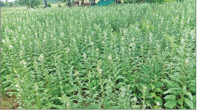
မြစ်သားမြို့နယ်၌ စိုက်ပျိုးထားသည့် နွေနှမ်းစိုက်ခင်း အောင်မြင်ဖြစ်ထွန်းနေမှုကို တွေ့ရစဉ်။

ယခုနှစ်မိုးရာသီတွင် ကရင်ပြည်နယ်အတွင်း မိုးစပါး ၄၂၈၆၉၈ ဧက စိုက်ပျိုးရန်လျာထားဆောင်ရွက်လျက်ရှိပြီး အထွက်နှုန်းတိုးတက်ရေးနှင့် မိုးစပါးလျာထားဧကပြည့်စုံကျော်လွန်ရေးအတွက် ဆောင်ရွက်လျက်ရှိရာ ယနေ့နံနက်ပိုင်းက လှိုင်းဘွဲ့မြို့နယ် သမ္မာန်ကျေးရွာ ဝါးဆူးကွင်း၌ မိုးစပါးစိုက်ပျိုးရန် မြေဆီလွှာဖွံ့ဖြိုးတိုးတက်ရေးလုပ်ငန်းများ ဆောင်ရွက်ခြင်းကို ကွင်းသရုပ်ပြသသည်။ စာမျက်နှာ ၄ ကော်လံ ၁ သို့ ❏