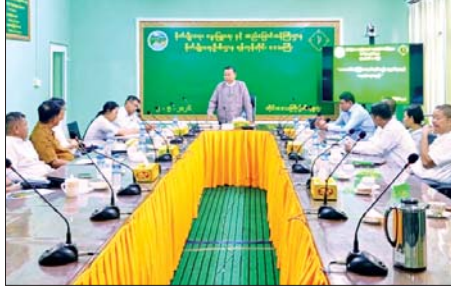
သည့် ကုမ္ပဏီ ၂၂ ခုမှ တာဝန်ရှိသူများက တောင်သူများ မိုးစပါးရာသီ၌ ဓာတ်မြေဩဇာ လျှော့ချသုံးစွဲပြီး ဓာတ်မြေဩဇာနှင့်

ရန်ကုန် ၈ မေ ၉ ရန်ကုန်တိုင်းဒေသကြီး အတွင်း စိုက်ပျိုးရေးတောင်သူများ သာဘာဝမြေဩဇာနှင့် ဇီဝမြေဩဇာများ ရေရှည်အသုံးပြုနိုင်ပြီး ပြည်ပသို့ တင်ပို့နိုင်ရေး တိုင်းဒေသကြီး စိုက်ပျိုးရေးဦးစီးဌာန ဦးစီးမှူးနှင့် မြေဩဇာကုမ္ပဏီများမှ တာဝန်ရှိသူများက မေ ၇ ရက်တွင် တိုင်းဒေသကြီး စိုက်ပျိုးရေးဦးစီးဌာန အစည်းအဝေးခန်းမ၌ တွေ့ဆုံဆွေးနွေးသည်။ ထိုသို့ တွေ့ဆုံဆွေးနွေးစဉ် တိုင်းဒေသကြီးဦးစီးမှူး ဦးတင်နိုင်နှင့် သာဘာဝမြေဩဇာ ထုတ်လုပ်