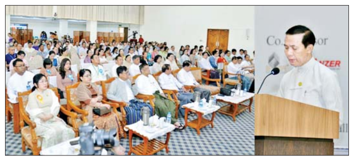
ထိုနေ့က ရန်ကုန်ပြည်သူ့ဆေးရုံကြီးဝင်း သိပ္ပံအဆင့် မြှင့်တင်နိုင်ရန်အတွက် လိုက်လံကြည့်ရှုစစ်ဆေးခဲ့ကြောင်း သိရသည်။ သတင်းစဉ်

ရန်ကုန် မေ ၉ မြန်မာနိုင်ငံ ပုဂ္ဂလိကဆေးရုံများအသင်း၏ (၁၄)ကြိမ်မြောက် သင်းလုံးကျွတ်နှစ်ပတ်လည်အစည်းအဝေးဖွင့်ပွဲကို ယနေ့ နံနက်ပိုင်းက ရန်ကုန်မြို့ ပြည်ထောင်စုသမ္မတမြန်မာနိုင်ငံ ကုန်သည်များနှင့် စက်မှုလက်မှုလုပ်ငန်းရှင်များအသင်းချုပ် (UMFCCI) မင်္ဂလာခန်းမ၌ ကျင်းပသည်။ ဦးစွာ ကျန်းမာရေးဝန်ကြီးဌာန ဒုတိယဝန်ကြီး ပါမောက္ခဒေါက်တာအေးထွန်းက မြန်မာနိုင်ငံ ပုဂ္ဂလိကဆေးရုံများအသင်းဝင်ဆေးရုံများ အရည်အသွေးစီ ကျန်းမာရေးစောင့်ရှောက်မှုပေးနိုင်ရေး၊ လူနာများ ဘေးကင်းလုံခြုံသောကုသမှုများ ဖြစ်စေရေးနှင့် သင့်တင့်မျှတသော ကုန်ကျစရိတ်ဖြင့် ဝန်ဆောင်မှုပေးနိုင်ရေးတို့ကို ထိန်းညှိကြပ်မတ်ပေးစေလိုကြောင်း ပြောကြားသည်။ ဆက်လက်ကျင်းပ သင်းနောက် နှစ်ပတ်လည်အစည်းအဝေးကို အစီအစဉ်အတိုင်း ဆက်လက်ကျင်းပသည်။