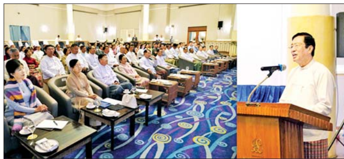
ညနေပိုင်းတွင် "Yangon Heritage Night Run 2026" ၁၅ ကီလိုမီတာ ညအပြေးပြိုင်ပွဲကို ညနေပိုင်းတွင် "Yangon Heritage Night Run 2026" ၁၅ ကီလိုမီတာ ညအပြေးပြိုင်ပွဲကို ညနေပိုင်းတွင် "Yangon Heritage Night Run 2026" ၁၅ ကီလိုမီတာ ညအပြေးပြိုင်ပွဲကို

တွေ့ဆုံစဉ် ပြည်ထောင်စုဝန်ကြီး မြန်မာ့ခရီးသွားလုပ်ငန်း မွန်လွှဲပိုင်းတွင် ပြည်ထောင်စုဝန်ကြီးသည် ဝန်ကြီးဌာနနှင့် ဖက်စပ်လုပ်ကိုင် ဆောင်ရွက်လျက်ရှိသော အင်းလျားလိတ်ဟိုတယ်၊ Hotel G နှင့် The Strand ဟိုတယ်တို့သို့ ကြည့်ရှုစစ်ဆေးပြီး အဆင့်အတန်းမီသော ဟိုတယ်ဆိုင်ရာဝန်ဆောင်မှုများ ပေးနိုင်ရေး မှာကြားသည်။