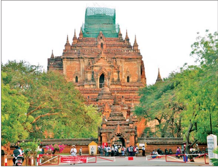
ပုဂံရှေးဟောင်း ယဉ်ကျေးမှု နယ်ပယ်မှ ထီးလုံမင်းလို ဘုရားကြီးသို့ လာရောက် လေ့လာကြည့်ရှုများကို တွေ့ရစဉ်။

သတင်းအချက်အလက်နှင့် နည်းပညာခေတ်၊ ဒစ်ဂျစ်တယ်ခေတ် သို့အရောက်တွင်လည်း ခရီးသွားလုပ်ငန်းက ခေတ်နှင့်အညီ လိုက်ပါစီးပွားရေးခေတ်နေသည်။ ယဉ်ကျေးမှုခရီးသွားလုပ်ငန်းသည်လည်း ခေတ်နှင့်အညီ လိုက်ပါပြောင်းလဲနေပါသည်လေ။ ဤနေရာ၌ “ယဉ်ကျေးမှု”နှင့် “ခေတ်နှင့်အညီ” ဆိုသော စကားလုံးနှစ်လုံးသည်