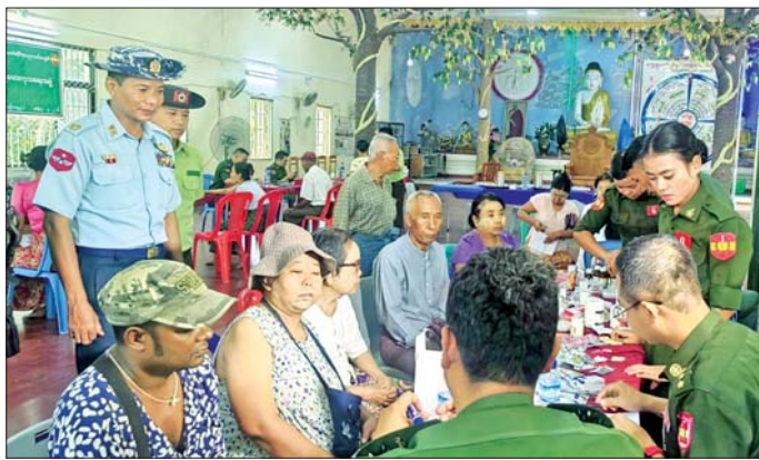
များနှင့် ဒေသပြည်သူများအား ကျန်းမာရေး စောင့်ရှောက်မှုလုပ်ငန်းများ ဆောင်ရွက်ပေးသည်။

နေပြည်တော် ၈ မေ ၉ ရန်ကုန်တိုင်းစစ်ဌာနချုပ် နယ်လှည့်ဆေးကုသရေးအဖွဲ့က ရန်ကုန်တိုင်းဒေသကြီး ထန်းတပင်မြို့နယ် ရေစိုကျေးရွာ ငြိမ်းအေးဓမ္မဗိမာန်၌ အခြေပြု၍ ယနေ့နံနက်ပိုင်းတွင် အဆိုပါကျေးရွာနှင့် ပတ်ဝန်းကျင်ကျေးရွာများရှိ သံဃာတော် ၁၅ ပါးနှင့် ဒေသခံပြည်သူ ၁၅၀ တို့အား အရိုးအကြောရောဂါ၊ ခွဲစိတ်ကုသမှုဆိုင်ရာရောဂါ၊ ကလေးရောဂါ၊ မျက်စိရောဂါ၊ နား/နှာခေါင်း/လည်ချောင်းရောဂါ၊ သွားနှင့်ခံတွင်းရောဂါ၊ သားပွားမီးယပ်ရောဂါ၊ အထွေထွေရောဂါတို့နှင့်ပတ်သက်၍ ကျန်းမာရေးစစ်ဆေးကုသခြင်းများ ဆောင်ရွက်ပေးသည်။ အလားတူ အလယ်ပိုင်းတိုင်းစစ်ဌာနချုပ် နယ်လှည့်ဆေးကုသရေးအဖွဲ့က မန္တလေးတိုင်းဒေသကြီး အောင်မြေသာစံမြို့နယ် ရန်မျိုးလှရပ်ကွက် မဟာဓမ္မပါလကျောင်း နန်းဦးကျောင်းတိုက် အဂ္ဂမဟာဂုဏ်ရည်ကျောင်းဆောင်၌ သံဃာတော်