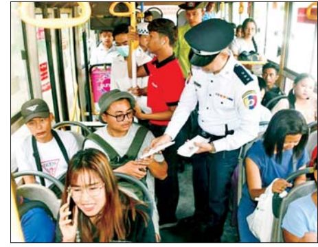
အညီ မောင်းနှင်စေရေး အသိပညာပေး လက်ကမ်းစာစောင်များ ပြန့်ဝေခြင်းတို့ ဆောင်ရွက်ခဲ့ကြောင်း သိရသည်။

ရန်ကုန် မေ ၉ ရန်ကုန်တိုင်းဒေသကြီး ပဟန်းမြို့နယ် ဆရာစံရပ်ကွက် ကမ္ဘာအေးဘုရားလမ်းပေါ်ရှိ မြန်မာပလာစာစေ့၌ ယာဉ်အန္တရာယ် လမ်းအန္တရာယ် ကင်းရှင်းရေး ရက် (၁၀၀)စီမံချက်ဖြင့် ယနေ့နံနက်ပိုင်းတွင် ဆောင်ရွက်သည်။ ထိုသို့ ဆောင်ရွက်ရာတွင် မြို့နယ်စီမံခန့်ခွဲရေးနှင့် အုပ်ချုပ်ရေးကော်မတီကြီးကြပ်မှုဖြင့် ပဟန်းမြို့နယ် အမှတ်(၄၄) ယာဉ်ထိန်းရဲတပ်ဖွဲ့မှူးမှူး ဒုတိယရဲမှူးနှင့် တပ်ဖွဲ့ဝင်များက ယာဉ်အန္တရာယ် လမ်းအန္တရာယ်ကင်းရှင်းရေး လူကူးမျဉ်းကျားမှ ဖြတ်သန်းသွားလာမှု ရှိစေရေး လူကူးမျဉ်းကျားတွင် လမ်းကူးသူများအား လက်တွဲဖမ်းမ လမ်းကူးခြင်း၊ မော်တော်ယာဉ်များအနေဖြင့် ၂၀၂၀ ပြည့်နှစ် ယာဉ်အန္တရာယ်ကင်းရှင်းရေးနှင့် မော်တော်ယာဉ်စီမံခန့်ခွဲမှုဥပဒေနှင့်