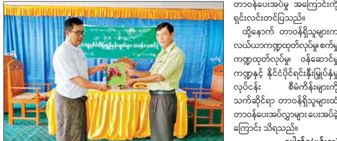
ပေါက်စ(မင်းလှ)

မင်းလှ မေ ၉ တာဝန်ပေးအပ်ပွဲ အခမ်းအနားကို ဦးစွာ မြို့နယ်စီမံခန့်ခွဲရေးနှင့် ပဲခူးတိုင်းဒေသကြီး မင်းလှ မေ ၈ ရက် နံနက်ပိုင်းက မြို့နယ် အုပ်ချုပ်ရေးကော်မတီ ဥက္ကဋ္ဌ မြို့နယ်၏ ၂၀၂၄-၂၀၂၅ ဘဏ္ဍာနှစ် အထွေထွေအုပ်ချုပ်ရေး ဦးစီးဌာန (ဧပြီလမှ မတ်လအထိ) ဒေသန္တရ ရုံးအစည်းအဝေးခန်းမ၌ ကျင်းပ စီမံကိန်း ရည်မှန်းချက်များ သည်။