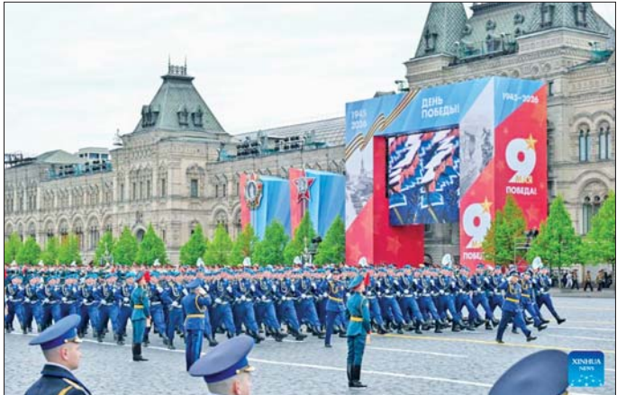
အောင်ပွဲနေ့ချီတက်ပွဲအခမ်းအနားကို ၁၉၉၅ ပြုလုပ်လျက်ရှိသည်။ ကိုးကား - ဆင်ပွား ခုနှစ်မှ စတင်ကာ နှစ်စဉ် မေ ၉ ရက်တွင် ကျင်းပ တာဘာပြန် - အောင်ကျော်ကျော်

သမ္မတပူတင်က ပြောကြားသည်။ ဆိုဗီယက်တပ်ဖွဲ့များက ဥရောပပြည်သူများ၏ လွတ်လပ်မှုနှင့် ဂုဏ်သိက္ခာအတွက် ကြိုးမားသော စတေးမူကို ပြုလုပ်ခဲ့ကြောင်း ပူတင်က ဆက်လက်ပြောကြားသည်။ လက်ရှိတွင် ရုရှားနိုင်ငံသည် မြောက်အတ္တလန္တိတ်စာချုပ်အဖွဲ့ (NATO)၏ လက်နက်တပ်ဆင်ပိုင်းမှူးရှိထားသော ရန်လိုသည့် အင်အားစုတစ်ခုနှင့် ထိပ်တိုက်ရင်ဆိုင်နေရကြောင်း သမ္မတပူတင်က ပြောကြားသည်။ အဆိုပါ ချီတက်ပွဲအခမ်းအနားတွင် မြောက်ကိုရီးယားတပ်ဖွဲ့ဝင်များ ပါဝင်ကြောင်း သိရသည်။ အခမ်းအနားပြီးနောက် သမ္မတပူတင်နှင့် နိုင်ငံခေါင်းဆောင်များက Alexander Garden ရှိ အမည်မသိ တပ်မတော်သား ဂုဏ်ဇာတင်လွှမ်းလှမ်းပန်းခွေများ ချကြသည်။