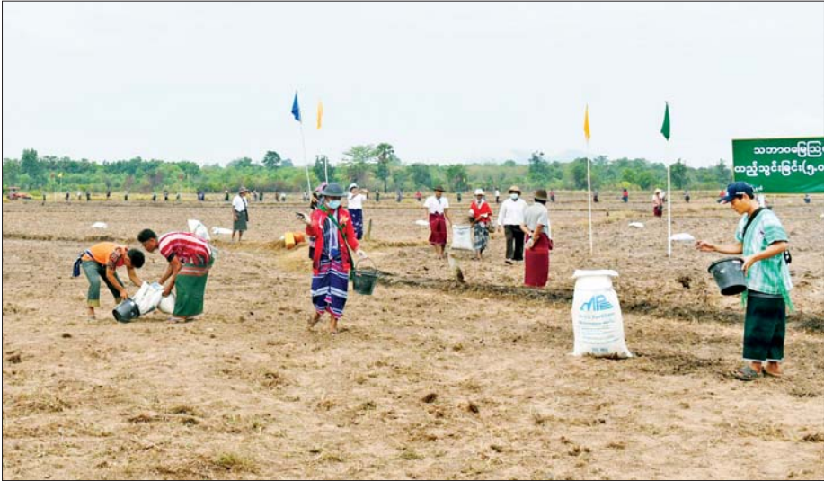
လှိုင်းဘွဲ့မြို့နယ် သမ္မာန်ကျေးရွာ ဝါးဆူးကွင်း၌ မိုးစပါးစိုက်ပျိုးရန် မြေဆီလွှာဖွံ့ဖြိုးတိုးတက်ရေး သစ်စိမ်းမြေဩဇာများ ကြပ်ကဲထည့်သွင်းစဉ်။

နေပြည်တော် မေ ၉ ယနေ့ညနေ ၃ နာရီခွဲ တိုင်းထွာချက်များအရ ဘင်္ဂလားပင်လယ် အော်အနောက်တောင်ပိုင်းတွင် မေ ၁၁ ရက်၌ လေဖိအားနည်းရပ်ဝန်း တစ်ခုဖြစ်ပေါ်နိုင်သည်ဟု ခန့်မှန်းရသည်။ မိုး/လေ