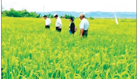
တာဝန်ရှိသူများက ကွင်းဆင်းကြည့်ရှုစစ်ဆေး

သမဝါယမနှင့် ကျေးလက်ဖွံ့ဖြိုးရေးဝန်ကြီးဌာန၊ သမဝါယမဦးစီးဌာန၊ ရှမ်းပြည်နယ်(တောင်ပိုင်း) ညောင်ရွှေမြို့နယ် သလင်းကျေးရွာရှိ ရောင်နီဦး စိုက်ပျိုးရေးနှင့် အထွေထွေလုပ်ငန်း သမဝါယမအသင်းမှ ရက် (၁၀၀)စီမံချက်ဖြင့် အသင်းသားတောင်သူများ စိုက်ပျိုးထားရှိသည့် နွေစပါးစိုက်ခင်းအား မေ ၉ ရက်တွင် ရှမ်းပြည်နယ် သမဝါယမဦးစီးဌာန ပြည်နယ်ဦးစီးမှူး ဦးကျော်မိုးတင့်နှင့် တာဝန်ရှိသူများက ကွင်းဆင်းကြည့်ရှုစစ်ဆေး