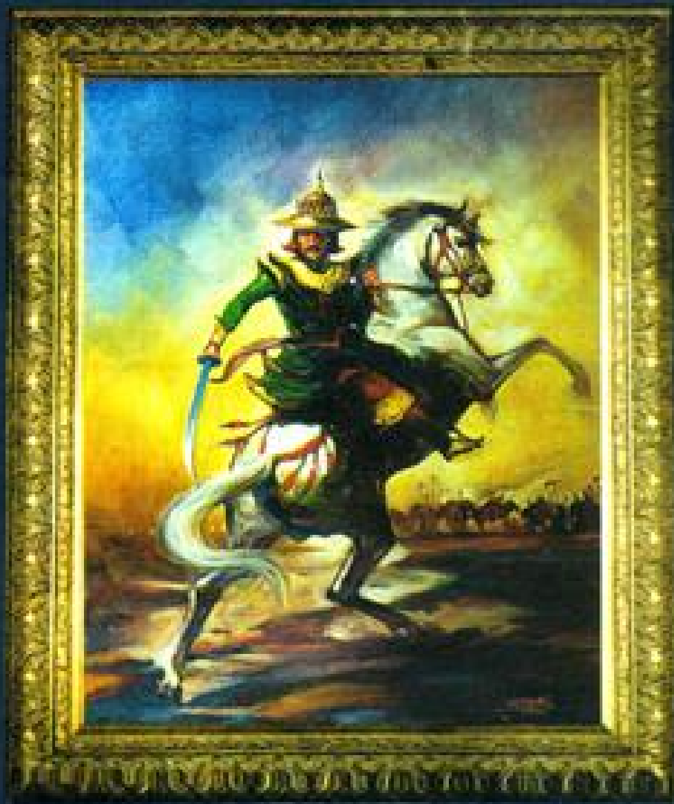
GRADE COMMANDER Artist Ko San Oil on Canvas 36" x 48"