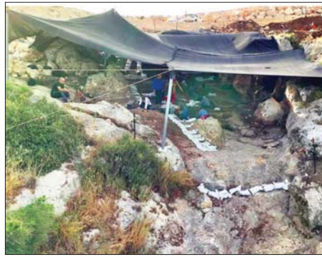
ဖြစ်ကြောင်း သုတေသီများက ပြောကြားခဲ့သည်။ ရှေးဟောင်းသုတေသနပညာ ရှင်များသည် ကျောက်လက်နက် ကိရိယာများ၊ တိရစ္ဆာန်အရိုးများ နှင့်အမဲလိုက်မှူးများကို ဆွဲဆောင် ခဲ့ဖွယ်ရှိသည့် ရေအရင်းအမြစ် များ၏ အထောက်အထားများကို တွေ့ရှိခဲ့ကြသည်။ ထို့ပြင် သမင်များ၊ ဂဇယ် သမင်များနှင့် ရှေးခေတ်မြင်းမျိုးစိတ် များ၏ အရိုးများကိုလည်း ရှာဖွေ တွေ့ရှိခဲ့ကြောင်း သိရသည်။ ဆင်ဟွာ

ထားသောသေတ္တာ (Time Capsule)” တစ်လုံးအဖြစ် တင်စား ဖော်ပြခဲ့ကြသည်။ မပျက်စီးဘဲ ထိန်းသိမ်းထားနိုင် အကြောင်းမှာ ယင်းဂူသည် နှစ်ပေါင်းထောင်ချီကြာ ပိတ်ဆို့ နေခဲ့သဖြင့် သမိုင်းမတင်မီခေတ် ၏ လူသိနည်းသော ကာလ တစ်ခုမှ လူနေမှုဘဝဆိုင်ရာ အထောက်အထားများကို မပျက် စီးဘဲ ထိန်းသိမ်းထားနိုင်ခဲ့ခြင်း ကြောင့် ဖြစ်သည်။ အစောဆုံးယဉ်ကျေးမှု ကာလမှဖြစ် ဟိုင်ဟာမြို့တောင်ဘက်ရှိ ဖူရဲ ဒီစီမြို့အနီးတွင် တွေ့ရှိခဲ့သော အဆိုပါနေရာသည် ကျောက်ခေတ် အစောပိုင်း၏ နောက်ဆုံးကာလ တွင် တည်ရှိခဲ့သော လူသားသမိုင်း အစောဆုံးယဉ်ကျေးမှု ကာလမှ