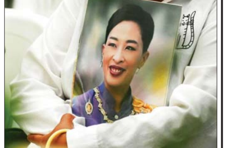
သိရသည်။ မင်းသမီး၏ ဈာပနကို အမြင့်ဆုံးချိုးကျူးဂုဏ်ပြုမှုဖြင့် အခမ်းအနားစီစဉ်ရန် ထိုင်းဘုရင်က အမိန့်ပေးခဲ့ကြောင်း သိရသည်။ ဆင်ဟွာ

ဘန်ကောက် ဇွန် ၁၂ ထိုင်းဘုရင် မဟာဗာဂျီရာလောင်ကွန်း၏ အကြီးဆုံးသမီးဖြစ်သူ ထိုင်းတော်ဝင်မင်းသမီး ဘာဂျက်တီယာဘာသည် ဇွန် ၁၁ ရက်က ကွယ်လွန်သွားကြောင်း တော်ဝင်အိမ်တော် ဗျူရီက ဇွန် ၁၂ ရက်တွင် ကြေညာခဲ့သည်။ တော်ဝင်မင်းသမီး ဘာဂျက်တီယာဘာသည် ဆေးရုံ၌ ဆေးကုသမှုခံယူနေခဲ့သည့်မှာ သုံးနှစ်ကျော်ကြာမြင့်ခဲ့ပြီး သက်တော် ၄၇ နှစ်အရွယ်၌ ကွယ်လွန်သွားခြင်းဖြစ်သည်။ မင်းသမီးသည် ဒေသ စံတော်ချိန် ၂၃ နာရီ ၄၈ မိနစ်တွင် ဘန်ကောက်မြို့ရှိ ချူလာ လောင်ကွန်းဆေးရုံ၌ ကွယ်လွန်သွားခြင်းဖြစ်ကြောင်း ဗျူရီက ကြေညာချက်ထုတ်ပြန်ခဲ့သည်။ မင်းသမီးသည် ၂၀၂၂ ခုနှစ် ဒီဇင်ဘာလကတည်းက အဆိုပါ ဆေးရုံ၌ ဆေးကုသမှုခံယူနေခဲ့ခြင်းဖြစ်သည်။ မင်းသမီးသည် ၂၀၂၂ ခုနှစ် ဒီဇင်ဘာ ၁၄ ရက်တွင် ၎င်း၏ခွေးကို လေ့ကျင့်ပေးနေစဉ် ရုတ်တရက် နှလုံးရပ်တန့်ကာ သတိလစ်မေ့မြောခဲ့ခြင်း ဖြစ်ကြောင်း