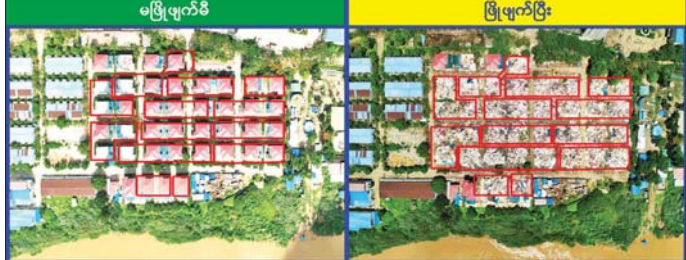
ကရင်ပြည်နယ် မြဝတီခရိုင် ရွှေကျော်လီနယ်မြေ၌ အွန်လိုင်းလောင်းကစားလုပ်ငန်းလုပ်ကိုင်ခဲ့သော တရားမဝင်အဆောက်အအုံအား မဖြိုဖျက်မီနှင့် မဖြိုဖျက်ဆီးပြီးစီးမှုကို တွေ့ရစဉ်။

ကျောပိုးမှ အဖွဲ့သည် သတင်းအရ မိုးညှင်း ရပ်တန့်စစ်ဆေးရာဖွဲ့ရာ စိတ်ကြံ ရွှေသွယ်ဆေးပြား ၂၀၀၀၀၀ (တစ်ပြား လျှင် ငွေကျပ် ၁၅၀၀ နှုန်းဖြင့် ၎င်း ဒေသတန်ဖိုးရမိသဖြင့် မြင့်သူအား ဖမ်းဆီးရမိသဖြင့် မြင့်သူအား မူးယစ်ဆေးဝါးနှင့်စိတ်ကိုပြောင်းလဲ စေသော ဆေးဝါးများဆိုင်ရာ ဥပဒေအရ အရေးယူထားသည်။ အလားတူဇွန် ၉ ရက် နံနက် ၅ နာရီတွင် မူးယစ်ဆေးဝါး တားဆီးနှိမ်နင်းရေး ရဲတပ်ဖွဲ့မှ တပ်ဖွဲ့ဝင်များပါဝင်သော ပူးပေါင်း