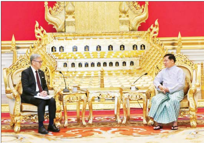
နိုင်ငံတော်သမ္မတ ဦးမင်းအောင်လှိုင် ထံ လာအိုပြည်သူ့ဒီမိုကရက်တစ်သမ္မတနိုင်ငံ၊ ဒုတိယဝန်ကြီးချုပ်နှင့် နိုင်ငံခြားရေးဝန်ကြီး H.E. Mr. Thongsavan PHOMVIHANE လာရောက်ဂါရဝပြုတွေ့ဆုံစဉ်။

ဦးစွာ နိုင်ငံတော်သမ္မတက လာအိုပြည်သူ့ဒီမိုကရက်တစ်သမ္မတနိုင်ငံ၊ ဒုတိယဝန်ကြီးချုပ်နှင့် နိုင်ငံခြားရေးဝန်ကြီးဦးဆောင်သည့် ကိုယ်စားလှယ်အဖွဲ့ကို မြန်မာနိုင်ငံမှ လိုက်လံဆွေးနွေးစွာဖြင့် ကြိုဆိုပါကြောင်း၊ မိမိနိုင်ငံတော်သမ္မတ တာဝန်ထမ်းဆောင်ပြီးနောက်ပိုင်းအာဆီယံအဖွဲ့ဝင်နိုင်ငံများနှင့် အိမ်နီးနားချင်းနိုင်ငံများမှ အထူးကိုယ်စားလှယ်များနှင့် နိုင်ငံခြားရေးဝန်ကြီးများအနေဖြင့် ယခုကဲ့သို့ တရားဝင်ခရီးစဉ်များ လာရောက်တွေ့ဆုံခြင်းသည်