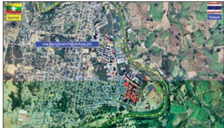
ကရင်ပြည်နယ် မြဝတီမြို့နယ် ရွှေကုက္ကိုလ်ဒေသရှိ အွန်လိုင်းလိမ်လည်လောင်းကစားမှုများလုပ်ကိုင်ခဲ့သည့် တရားမဝင် အဆောက်အအုံများအား ဖောက်ခွဲဖျက်ဆီးမှုပြုပြင်ပုံ။

နေပြည်တော် ဇွန် ၁၂ - အွန်လိုင်းလိမ်လည်လောင်းကစားမှုများကို အခြေချလုပ်ကိုင်ခဲ့ကြသည့် ကရင်ပြည်နယ် မြဝတီမြို့နယ် ရွှေကုက္ကိုလ်နယ်မြေနှင့် KK Park နယ်မြေများရှိ တရားမဝင် အဆောက်အအုံများအား အပြီးတိုင်ဖြိုချဖျက်ဆီးခြင်းများနှင့် လုပ်ငန်းလုပ်ဆောင်ရာတွင် အသုံးပြုခဲ့သည့် ပစ္စည်းများအား စနစ်တကျဖျက်ဆီးခြင်းများကို ဌာနဆိုင်ရာပူးပေါင်းအဖွဲ့များဖြင့် ဆောင်ရွက်လျက်ရှိရာ ယနေ့တွင် ရွှေကုက္ကိုလ်နယ်မြေအတွင်းရှိ တရားမဝင်သုံးထပ်လူနေအဆောက်အအုံ နှစ်လုံးကို ထပ်မံ၍ စနစ်တကျ ဖြိုချဖျက်ဆီးခဲ့သည်။ ရွှေကုက္ကိုလ်နယ်မြေအတွင်း၌ အွန်လိုင်းလိမ်လည် လောင်းကစား လုပ်ငန်းများ ကျူးလွန်ရာတွင်အသုံးပြုခဲ့သည့် အဆောက်အအုံ ၇၇ လုံးအနက် ယာဉ်၊ ယန္တရားများဖြင့် ဖြိုချဖျက်ဆီးမည့် အဆောက်အအုံ ၅၇ လုံးနှင့် ဖောက်ခွဲ၍ ဖျက်ဆီးမည့် စာမျက်နှာ ၁၇ ကော်လံ ၁