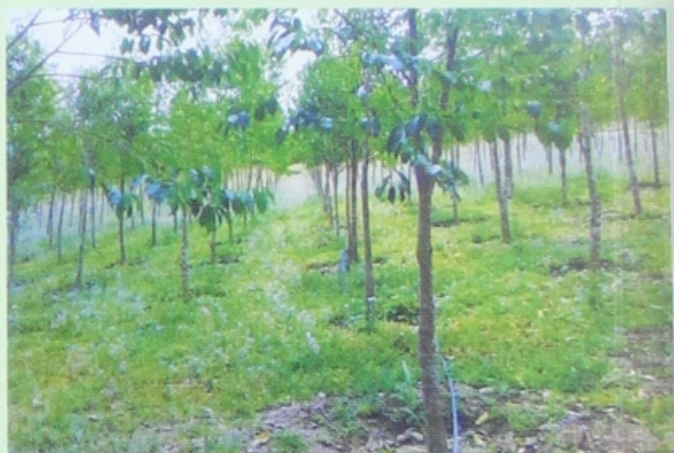
ရွှေလာငွေလာ သစ်မွေးပျိုးခြံ

ပြည်တွင်းဖြစ် ရှားပါးအဖိုးတန်ပျိုးပင်မျိုးစုံ၊ သစ်မွေး(ထိုင်းမျိုး/မြန်မာမျိုး) ပျိုးပင်အရွယ်စုံရောင်းဝယ်ရေးနှင့် သစ်မွေးမှိုဆေးသွင်းလုပ်ငန်း ဝန်ဆောင်မှုအကောင်းဆုံး ဆောင်ရွက်ပေးပါသည်။ ထိုင်းနိုင်ငံထုတ် CBG သစ်မွေးမှိုဆေးဖြန့်ချိရောင်းချပေးပါသည်။