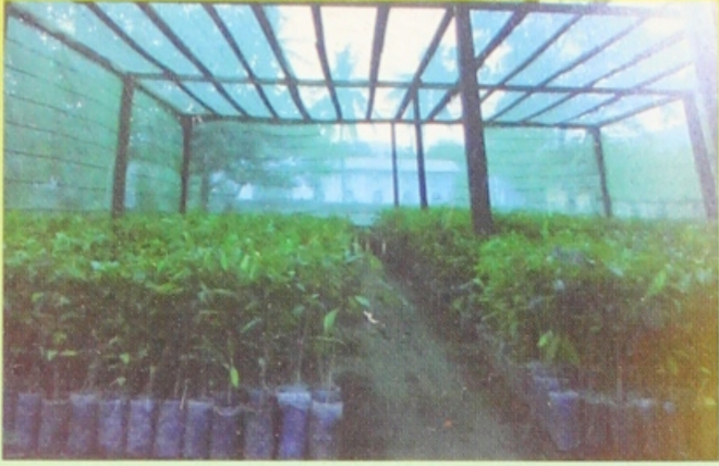
ရွှေလာငွေလာ သစ်မွေးပျိုးဥယျာဉ်

ရတနာပုံတိရိစ္ဆာန်ဥယျာဉ်နောက်၊ မန္တလေးမြို့။ ဖုန်း - ၀၉-၉၁၀၃၄၅၄၈၊ ၀၉-၄၀၂၇၃၇၇၉၃၊ ၀၉-၄၉၂၃၂၀၂၆