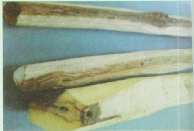
သစ်မွေးမှိုစွဲအသားစများ