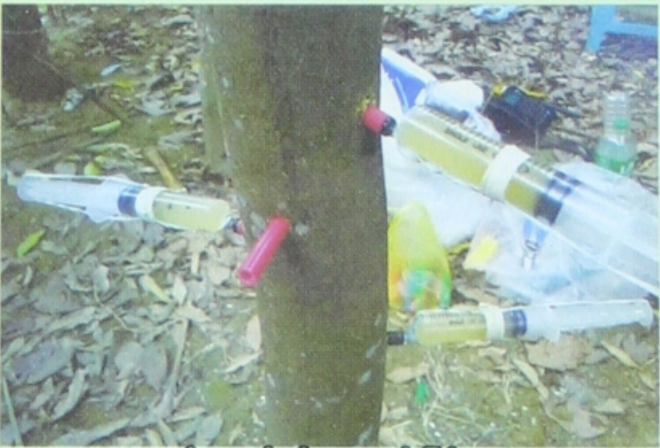
သစ်မွေးပင် မှိုဆေးသွင်းခြင်း