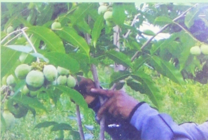
ရွှေလာငွေလာ သစ်မွေးပျိုးခြံ