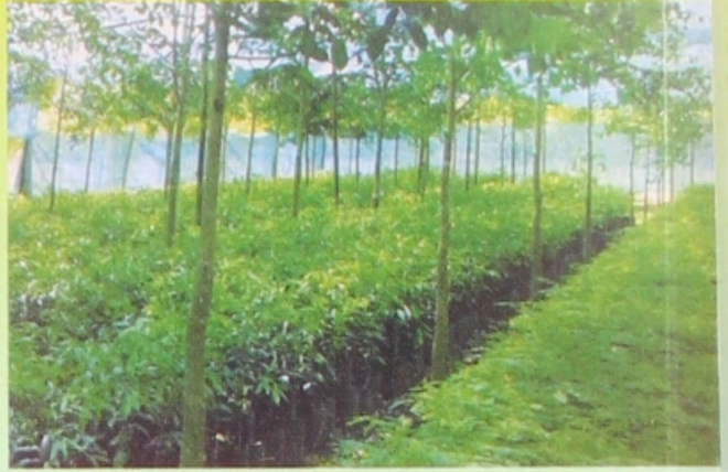
ရွှေလာငွေလာ ပျိုးပင်စုံဥယျာဉ်