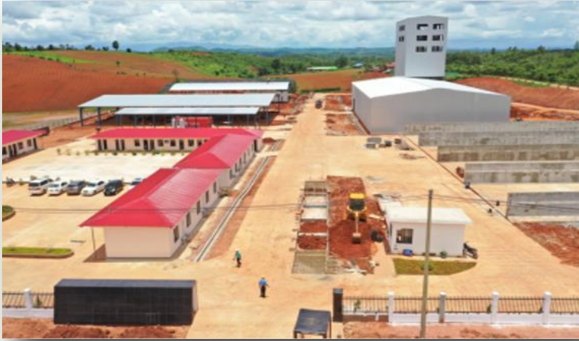
စက်ရုံအဆောက်အဦး