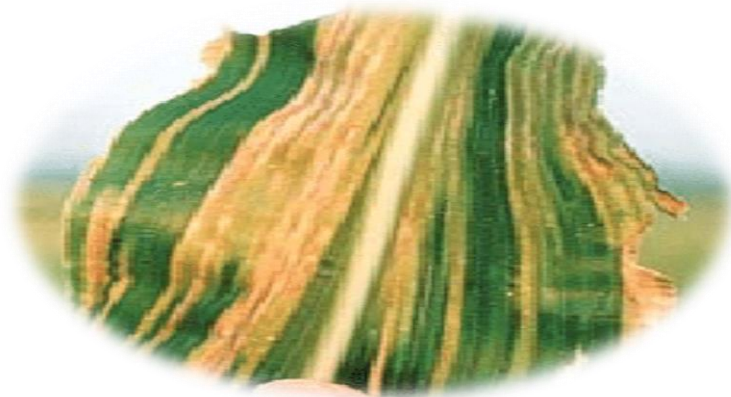
၂။ ဒေါင်းနီးမိုရောဂါ (Brown Stripe Downy Mildew Disease)