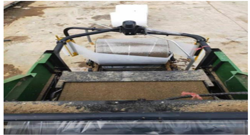
ကြိတ်ဖတ်များအားထုတ်ပိုးမှု