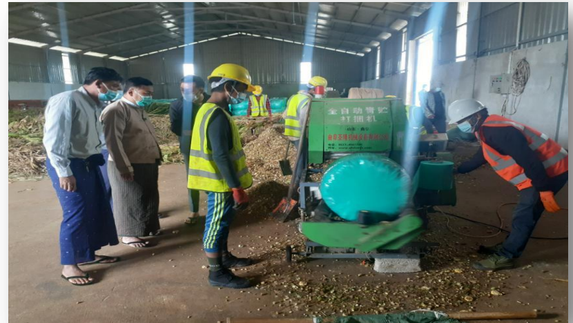
စက်ဖြင့်ကြိတ်ခွဲနေပုံ