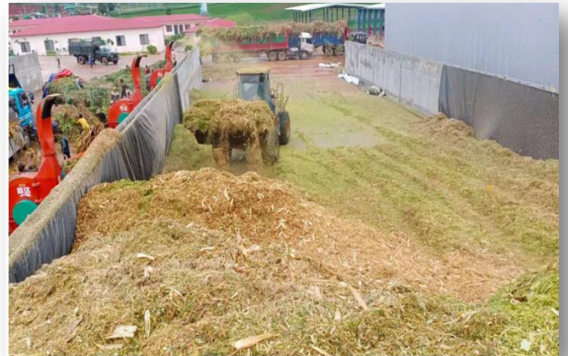
သိုလှောင်ကန်တွင်ထည့်သွင်းနေပုံ