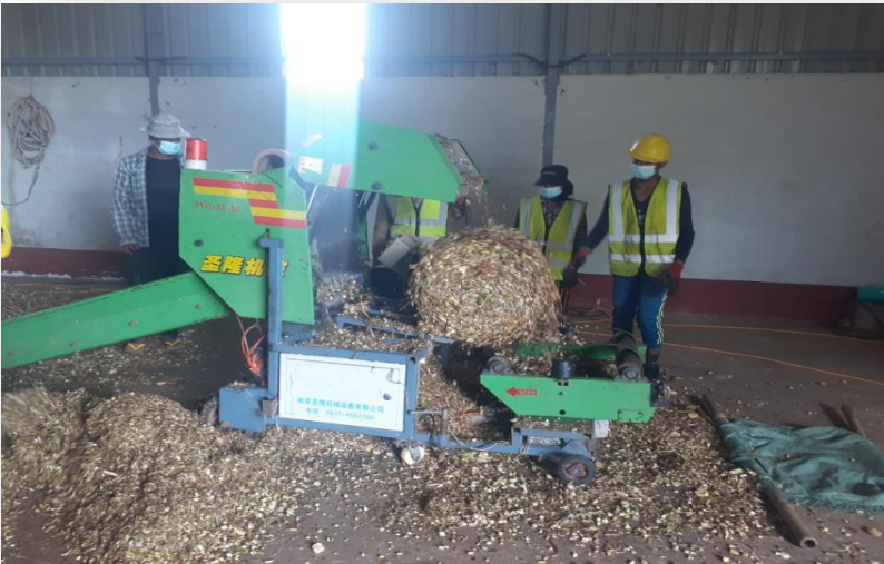
ကြိတ်ဖတ်များအားသိုလှောင်ထားရှိမှု