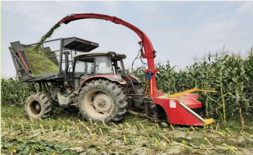
စက်ဖြင့်ရိတ်သိမ်းပြီးကြိတ်ခွဲနေပုံ