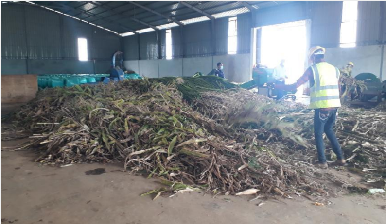
ပြောင်းပင်များရိတ်သိမ်းထားရှိမှု