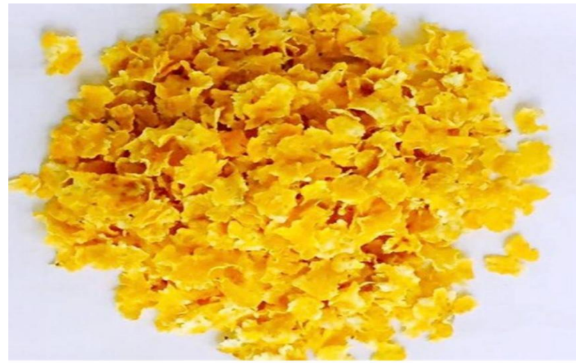
အဆင့်မြင့်နွားစာပြောင်းအစေ့ပြားပုံ