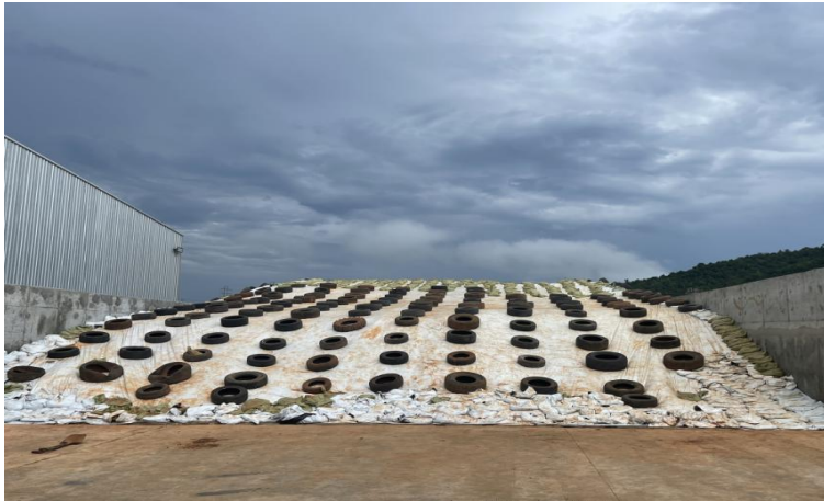
ပလပ်စတစ်အုပ်၍သိုလှောင်ထားပုံ