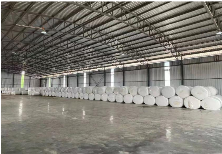
Silageများအားသယ်ယူသိုလှောင်ထားရှိမှု