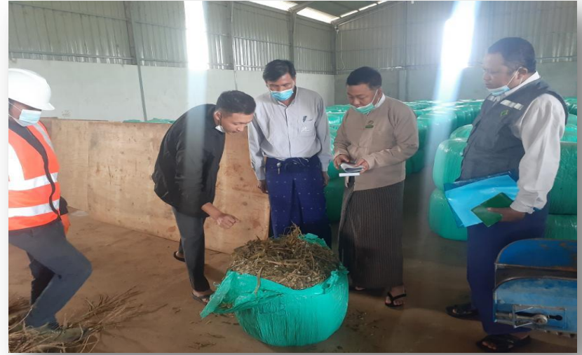
ထုတ်ပိုးပြီးစီးမှုအားစစ်ဆေးနေပုံ