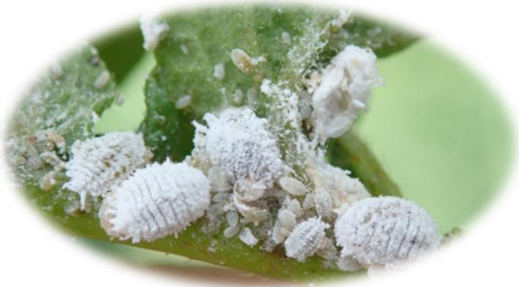
၁။ပိုးစေးနဲ့ (အင်းဆက်) (Mealybug)