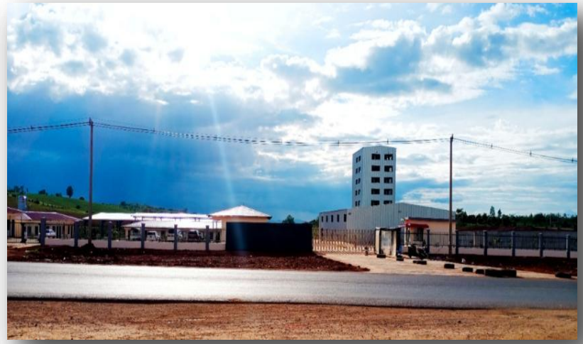
စက်ရုံအဆောက်အဦး