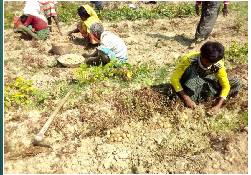
မိုးစပါးစံကွက်ရိတ်သိမ်းမှုနှင့် အာလူးရိတ်သိမ်းမှု မှတ်တမ်းပုံ