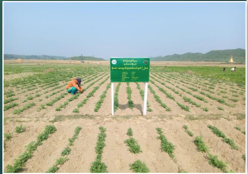
သပြေတောကျေးရွာ မိုးစပါး(ပ-သီးနှံ) စိုက်ပျိုးမှု မှတ်တမ်းပုံ