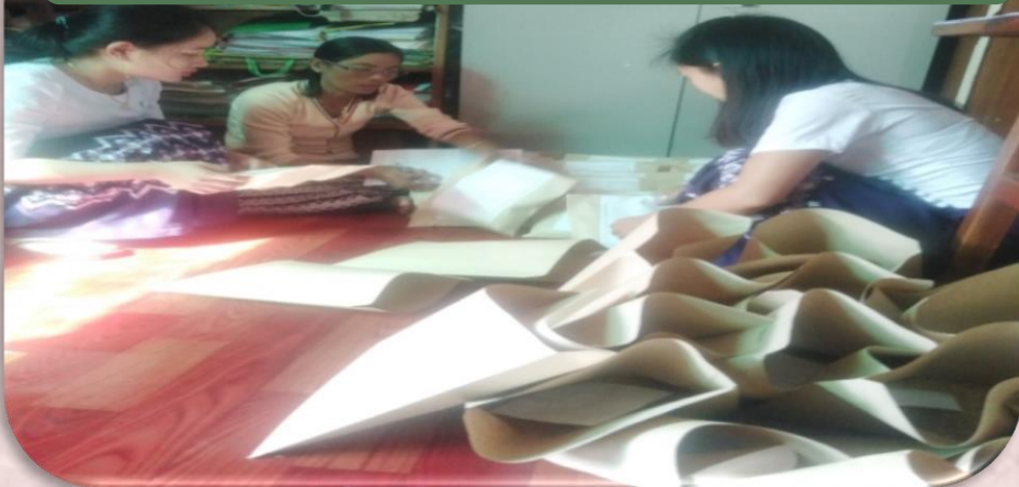
(ပုံ-၂၁) မျိုးစေ့နမူနာပို့ရန်ဆောင်ရွက်နေမှု။