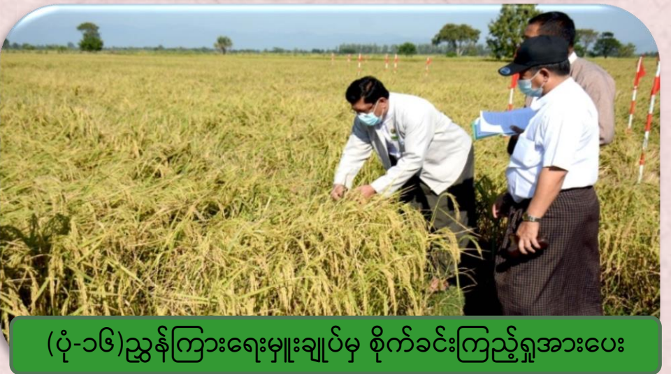
(ပုံ-၁၆) ညွှန်ကြားရေးမှူးချုပ်မှ စိုက်ခင်းကြည့်ရှုအားပေး