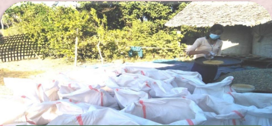
(ပုံ-၁၉)မျိုးစေ့နမူနာယူနေပုံ