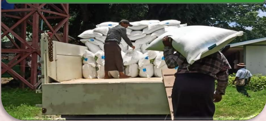
ပုံ(၁) တောင်သူလက်ဝယ်အရောက် မျိုးများပို့