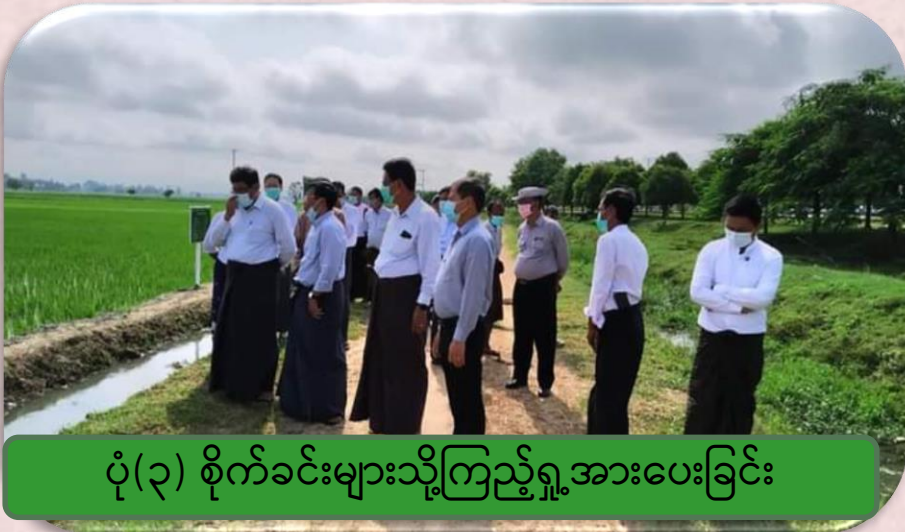
ပုံ(၃) စိုက်ခင်းများသို့ကြည့်ရှုအားပေးခြင်း