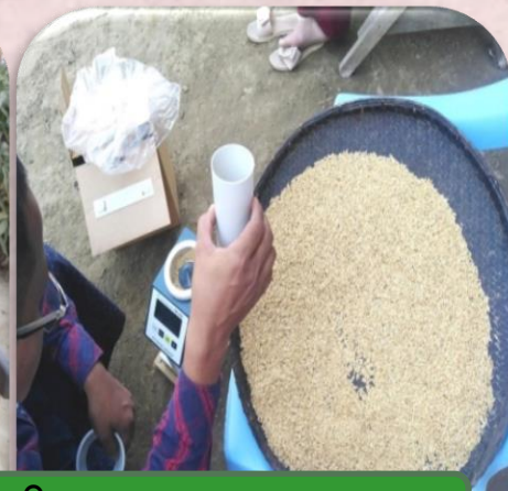
(ပုံ-၂၀)အစိုဓါတ်တိုင်းမျိုးစေ့နမူနာယူနေပုံ