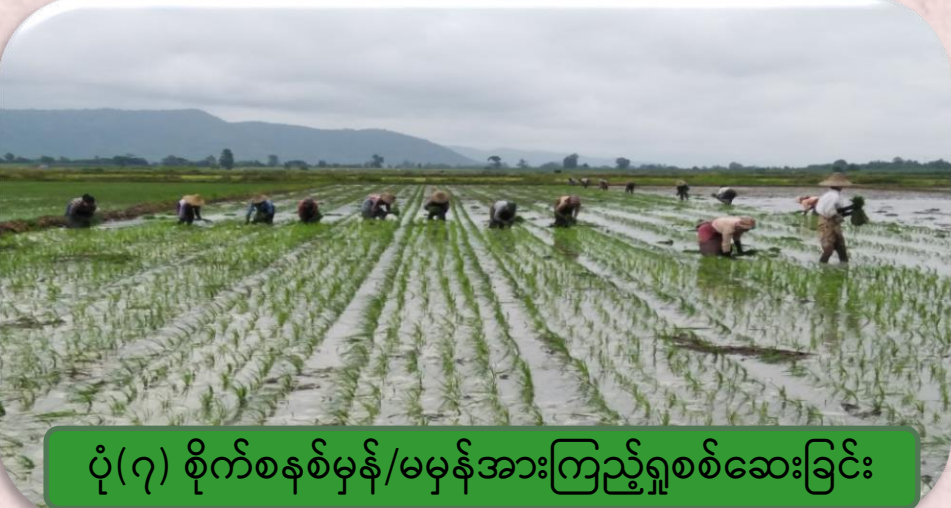
ပုံ(၇) စိုက်စနစ်မှန်/မမှန်အားကြည့်ရှုစစ်ဆေးခြင်း