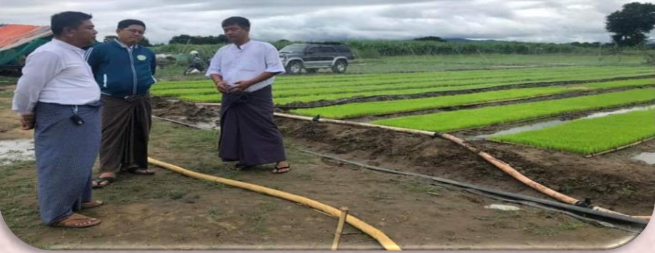
ပုံ(၅) ပျိုးထောင်ထားရှိမှုအားကြည့်ရှုစစ်ဆေးခြင်း