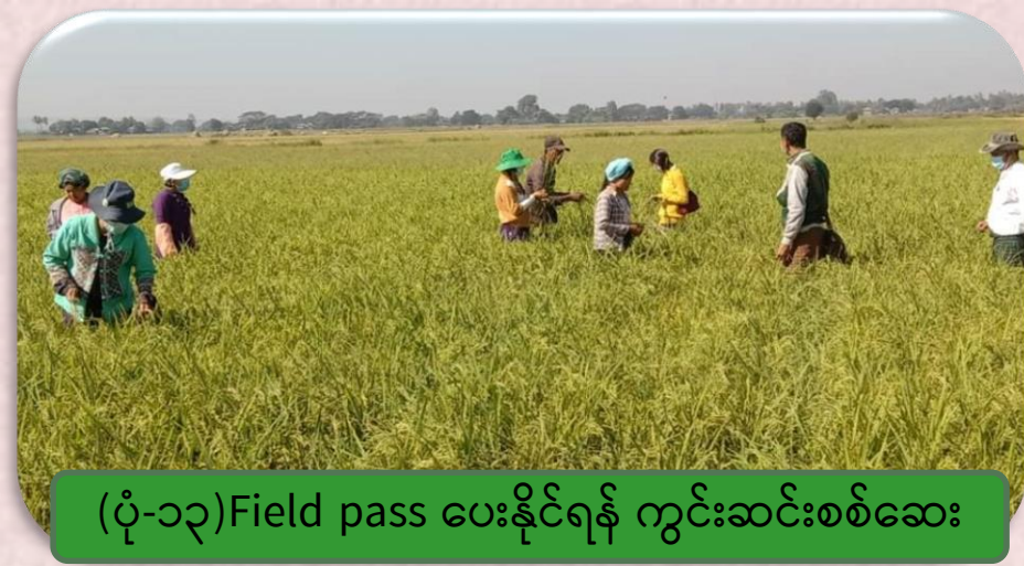
(ပုံ-၁၃) Field pass ပေးနိုင်ရန် ကွင်းဆင်းစစ်ဆေး