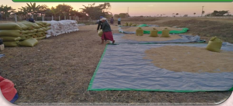
(ပုံ-၁၇)သန့်စင်အခြောက်လှန်းနေမှုအားကြည့်ရှု