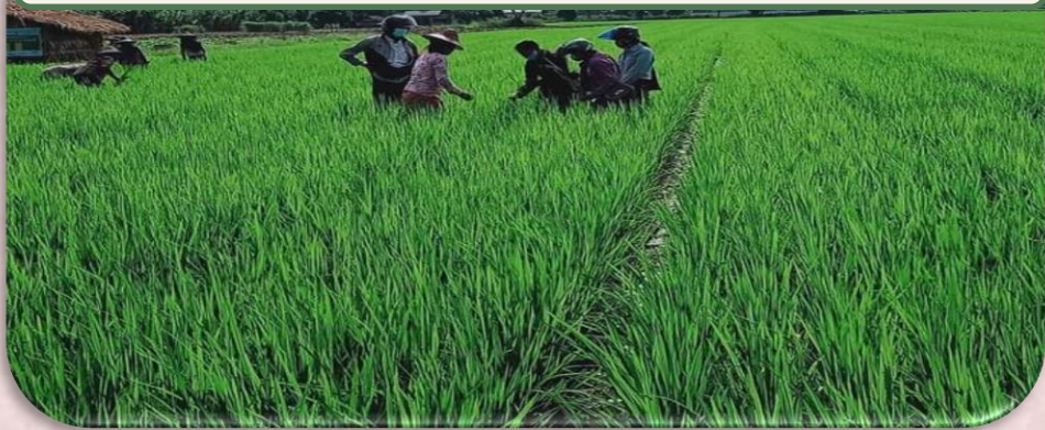
(ပုံ-၉) မျိုးကွဲနှုတ်ပယ်နေမှုအားလက်တွေ့ပြသစစ်ဆေး