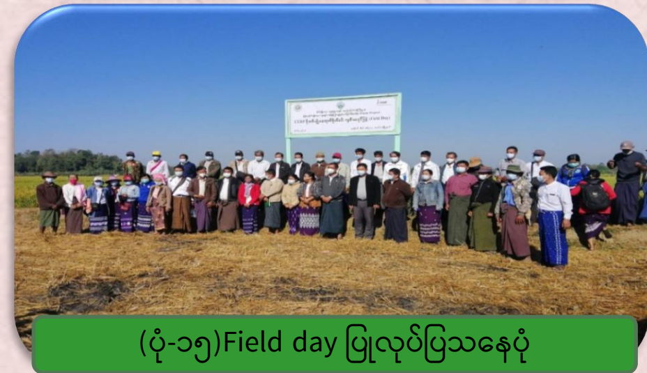
(ပုံ-၁၅) Field day ပြုလုပ်ပြသနေပုံ