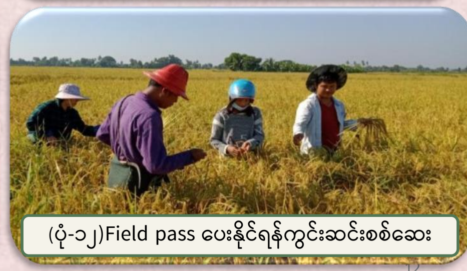
(ပုံ-၁၁) Field pass ပေးနိုင်ရန်ကွင်းဆင်းစစ်ဆေး