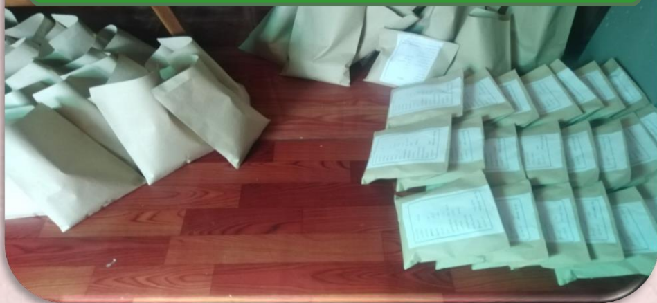
(ပုံ-၂၂) မျိုးစေ့နမူနာပို့ရန်ဆောင်ရွက်နေမှု။