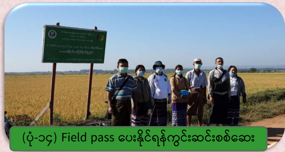
(ပုံ-၁၄) Field pass ပေးနိုင်ရန်ကွင်းဆင်းစစ်ဆေး