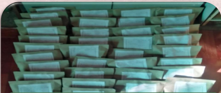
(ပုံ-၂၃) မျိုးစေ့နမူနာပို့ရန်ဆောင်ရွက်နေမှု။