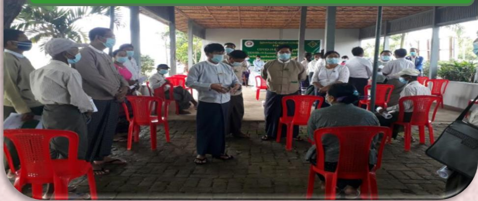
ပုံ(၂) တောင်သူများအားထောက်ပံ့ငွေပေးအပ်ပွဲ