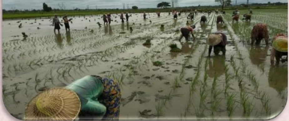
ပုံ(၆) စိုက်စနစ်မှန်/မမှန်အားကြည့်ရှုစစ်ဆေးခြင်း