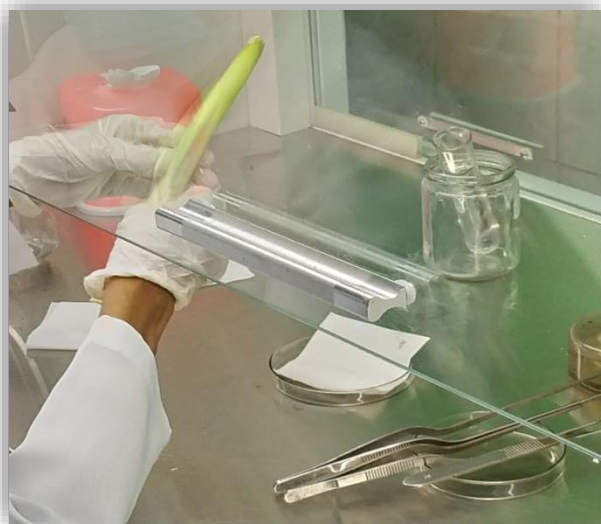
( ၄ ) explant အားရွက်ဖုံးခွာခြင်း