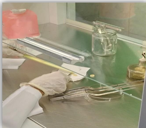
( ၅ ) explant အား ပိုင်းဖြတ်ခြင်း