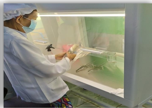
( ၃ ) ကိရိယာများအားပိုးသန့်ခြင်း