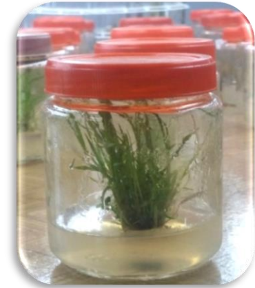
Shoot Culture (2 months)