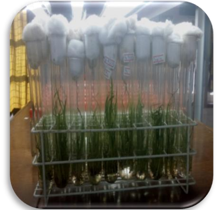
Root Culture (1 month)