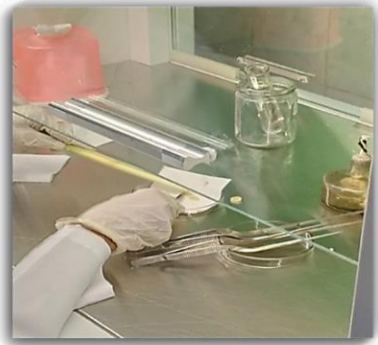
Meristem culture (1.5-Month)