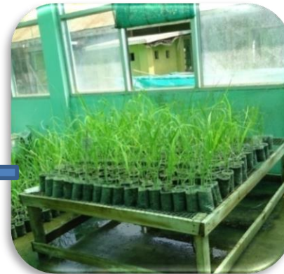
Hardening Stage (2 month)