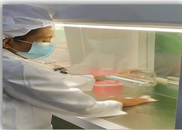
( ၂ ) Laminarflow အတွင်းပိုးသန့်ခြင်း