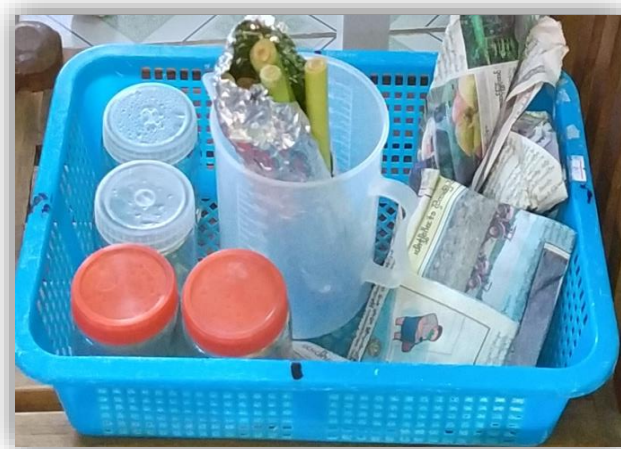
( ၁ ) ဆောင်ရွက်မည့်ပစ္စည်းများ