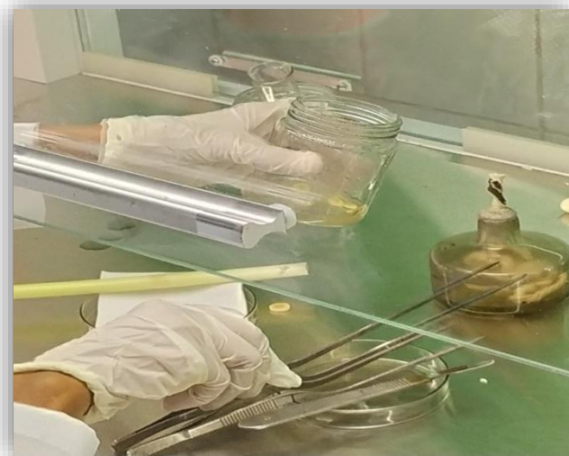
( ၆ ) media ပေါ်တင်ခြင်း