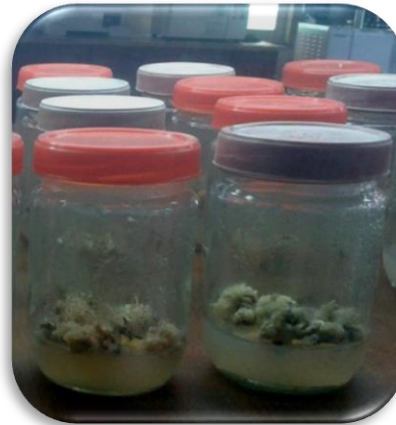
Callus culture (1.5-month)