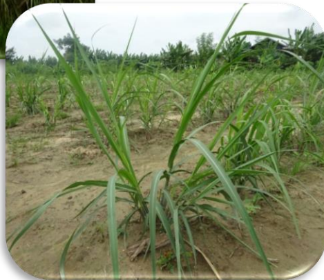
More tillers from tissue plant