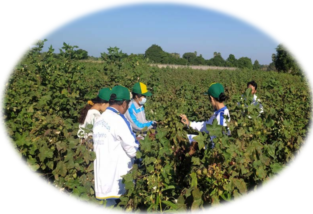
ကွင်းဆင်းမှတ်တမ်းကောက်ယူနေပုံ