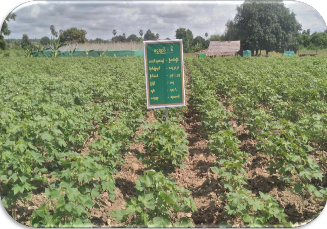
ငွေချည်-၆ စမ်းသပ်ကွက် မှတ်တမ်းဇယားပုံ