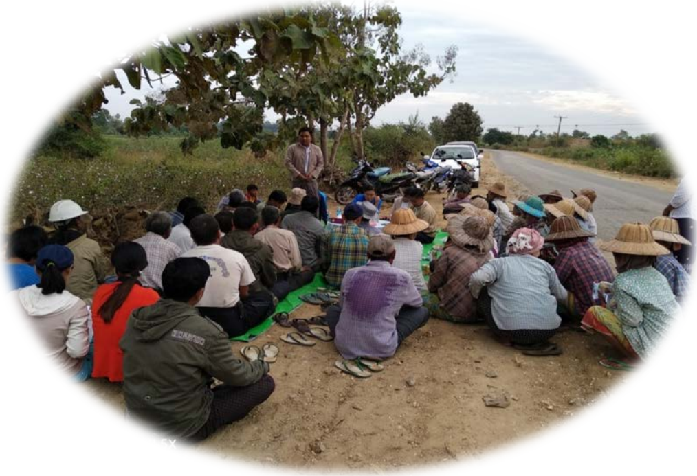
တွေ့ရှိချက်များကို မြို့နယ်ဦးစီးမှူးမှ တောင်သူများသိရှိစေရန် ပညာပေးဆောင်ရွက်နေပုံ