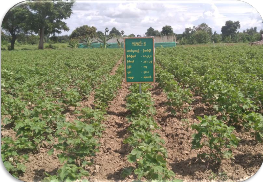
ငွေချည်-၉ စမ်းသပ်ကွက် မှတ်တမ်းဇယားပုံ