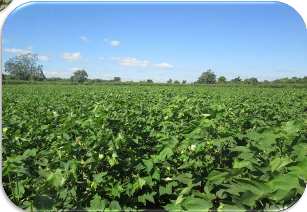
အပင်ဖြစ်ထွန်းမှု မှတ်တမ်းဇာတ်ပုံ