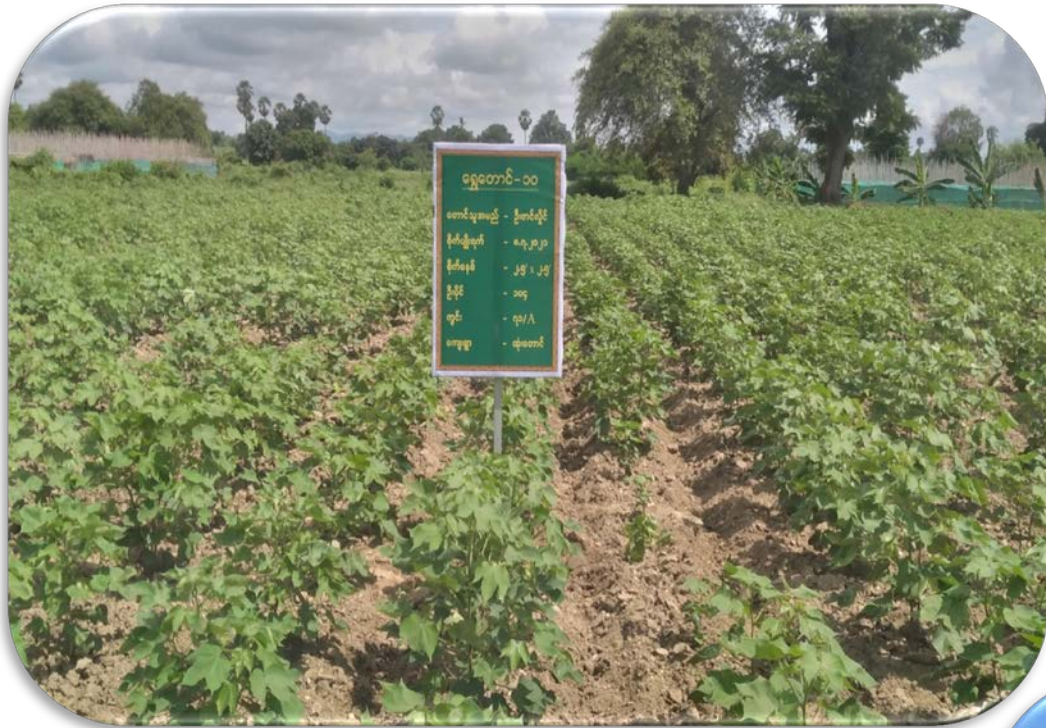
ရွှေတောင်-၁၀ စမ်းသပ်ကွက် မှတ်တမ်းဇာတ်ပုံ